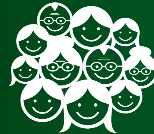
Aglutinamiento y Participación

De este modo con los “clientes” ya aglutinados previamente o con mucha demanda que da soporte, es más sencillo y económico obtener lo deseado. Además, se estimula y se facilita a entidades públicas o privadas a participar en buscar o proponernos las soluciones que deseamos.