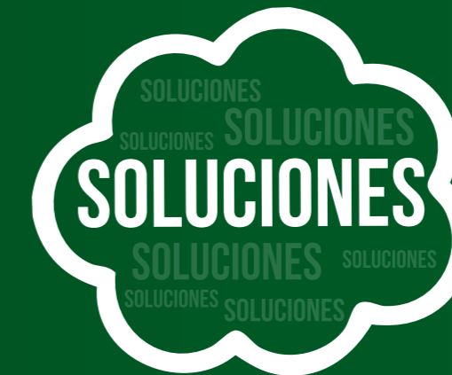
Demanda de Soluciones